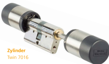
Zylinder Twin 7016