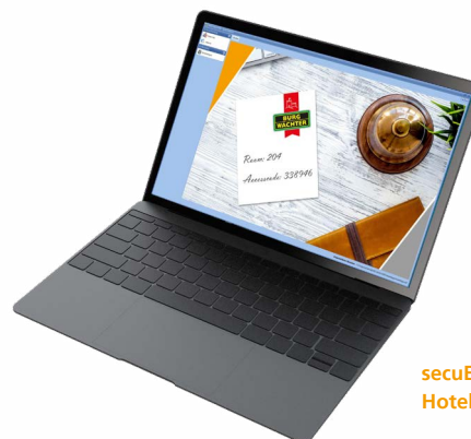
secuENTRY pro 7085 Hotel Software