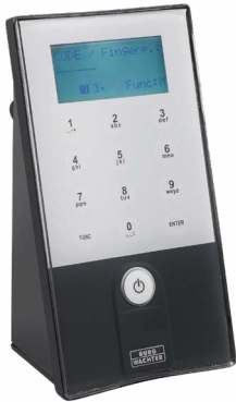
Tastatur Mit Zahlencode