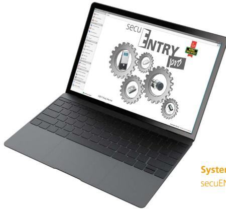
System Software secuENTRY pro 7083