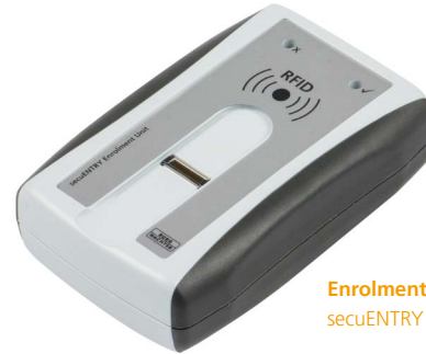
Enrolment secuENTRY pro 7073