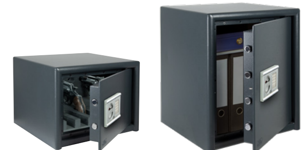
M 520 E