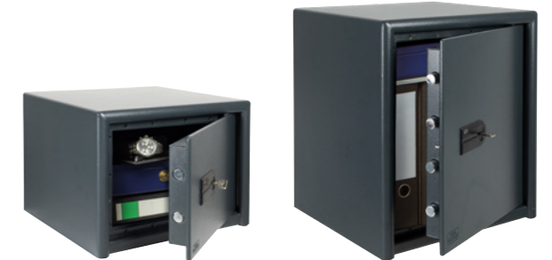
M 520 S