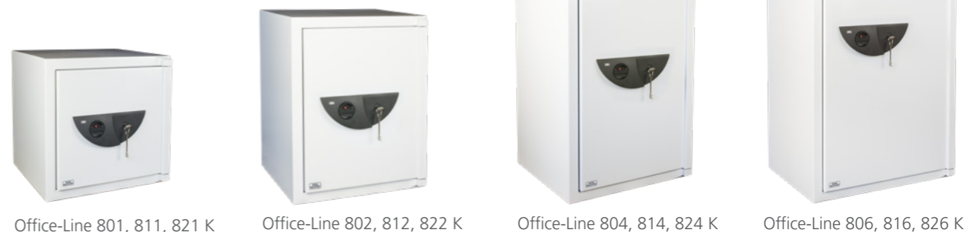
Office-Line 801, 811, 821 K Office-Line 802, 812, 822 K Office-Line 804, 814, 824 K Office-Line 806, 816, 826 K