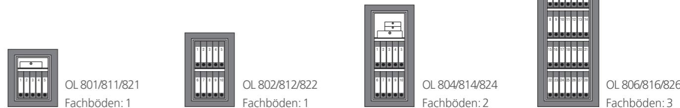
OL 801/811/821 Fachböden: 1 OL 802/812/822 Fachböden: 1 OL 804/814/824 Fachböden: 2 OL 806/816/826 Fachböden: 3